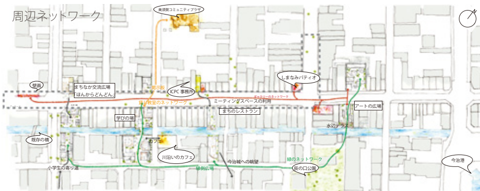
周辺ネットワーク